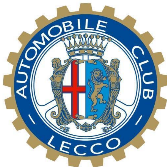
AUTOMOBILE CLUB LECCO

In base all'azione di coordinamento della rete commerciale a marchio ACI, e allo svolgimento delle attività connesse e strumentali a tale marchio, AC Lecco provvede alla fornitura delle specifiche sull'insegna standard per le delegazioni di nuova apertura. Si riportano di seguito le specifiche dell'insegna.